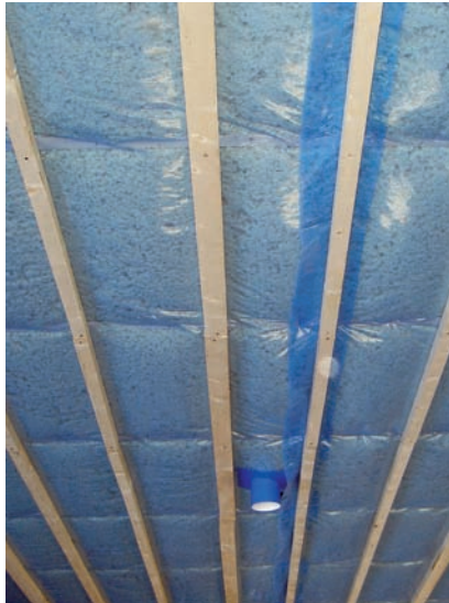
Höyrynsulku on limitetty kattoverhouksen koolauksen kohdalta.